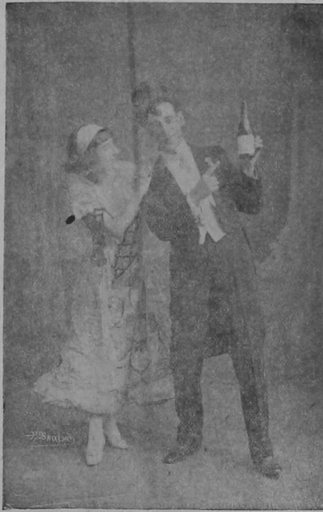
Duetto Español Alegría

El 23 del presente tuvo lugar en el Variedades el debut del simpático duetto Alegría que hace actualmente las delicias del público josefino.